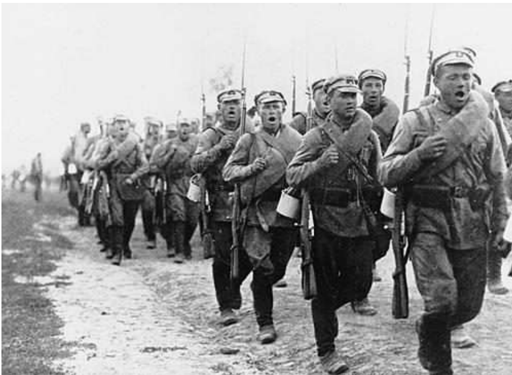
1918 — Начался Ледовый поход (он же Первый кубанский поход) русской Добровольческой армии.