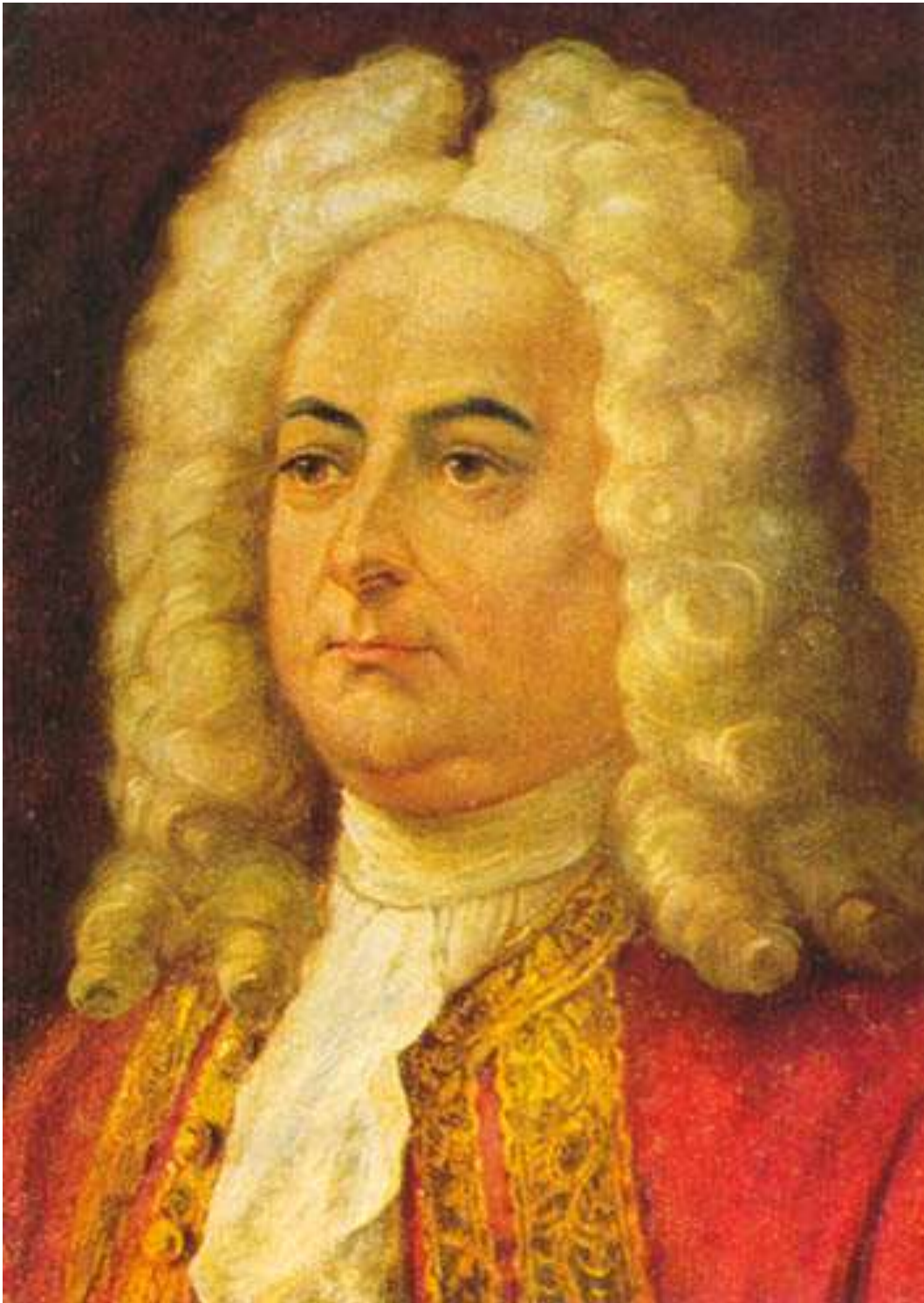
1744 — Майер Амшель Ротшильд , основатель международной династии предпринимателей.